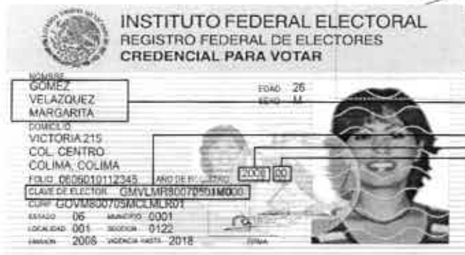
Anverso de la credencial

Lo que hace grande a un país es la participación de su gente