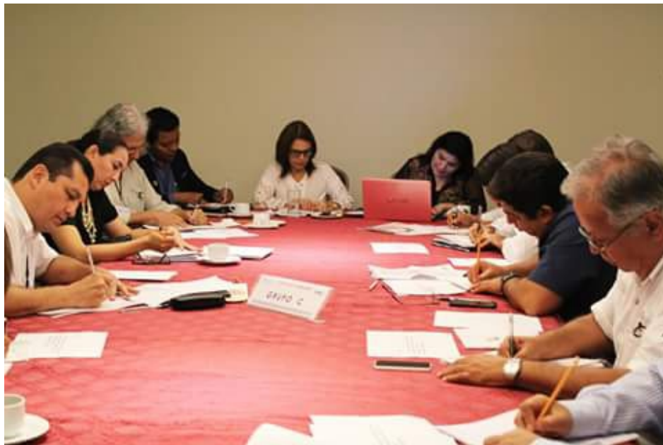
Figura 22. Participación en el Taller de Cultura Cívica organizado por el Instituto Nacional Electoral con sede en Yucatán.