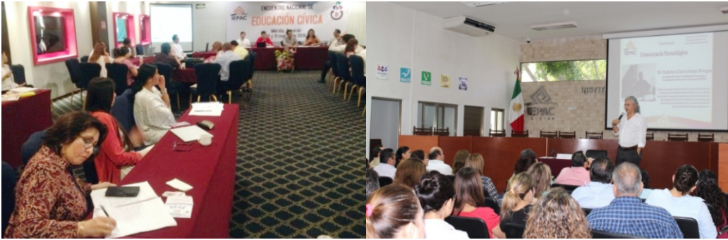
Figura 35 y 36. Aspectos del Segundo Encuentro Nacional de Educación Cívica y el Ciclo de Conferencias “Significado y sentido de los Principios Rectores en el Servicio Profesional Electoral”.

Asimismo, se elaboró y supervisó el protocolo y logística para la firma de los siguientes convenios.