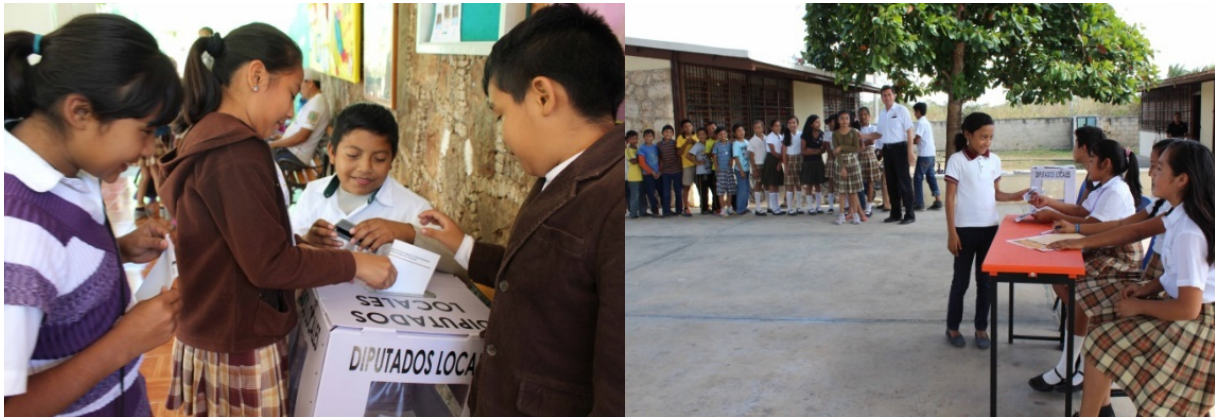
Figuras 8 y 9. Los estudiantes votaron para elegir qué valor de la democracia consideran que debe imperar en su escuela y comunidad.

El Instituto tiene el pleno convencimiento de que la democracia se consolida desde la niñez, es por ello que se diseñó el programa cívico infantil “ Aprendiendo y Aplicando los Valores de la Democracia ”, dirigido a alumnos de sexto grado de primaria.