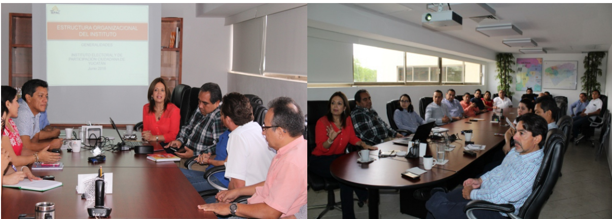
Figuras 17 y 18. Se explicó al personal del Instituto sobre los cambios en el organigrama para dar cumplimiento a lo estipulado por el Servicio Profesional Electoral Nacional.

Se presentó al personal del Instituto la “Estructura Organizacional del Instituto Electoral y de Participación Ciudadana de Yucatán, adecuada al Estatuto y Catálogo de Puestos y Servicios del Servicio Profesional Electoral Nacional”.