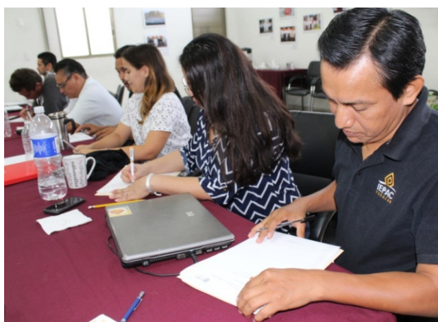
Figura 6. Personal del Instituto planeó y elaboró la base para la creación de las asignaturas “Formación de una Ciudadanía Participativa” y “Formación Político Electoral”, con el fin de fomentar la participación ciudadana desde las aulas en la UADY.

Con el fin de apoyar a la UADY en la creación de una asignatura optativa dirigida a estudiantes de nivel licenciatura, cuyo contenido se enfoque a la Educación Cívica y/o Derecho Electoral, el personal del IEPAC participó en el curso-taller “Elaboración de programas de estudio para asignaturas libres” , impartido por personal de la UADY, dotando a los participantes de criterios, guías y esquemas establecidos para conformar dos nuevas materias.