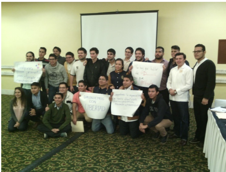
Figura 5. Los participantes del taller aprendieron mediante diversas estrategias y técnicas que incluyeron ejercicios prácticos, exposiciones interactivas y trabajo en equipo.