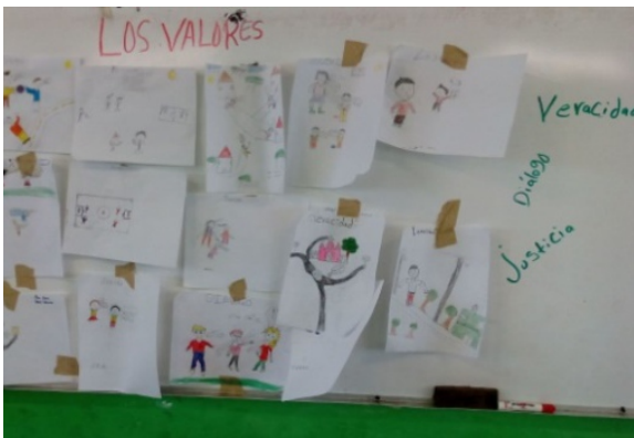
Figura 10. Mural de la escuela primaria Francisco J. Mujica del municipio de Cantamayec, Yucatán.

Con esta actividad se generó acercamiento positivo con los directivos y docentes de las primarias del interior del estado, comprometidos a continuar desarrollando en los niños y niñas acciones que promuevan la convivencia positiva y la aplicación de los valores de la democracia.