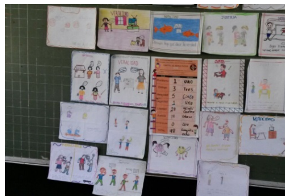
Figura 11. Mural de la escuela primaria Sebastián Díaz Marín del municipio de Chumayel, Yucatán.