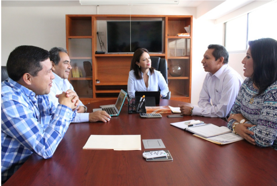
Figura 1. Reunión de trabajo de la Junta General Ejecutiva y Titulares de área.

Para atender asuntos relacionados con temas presupuestales y de índole administrativo la Junta General Ejecutiva sesionó en cinco ocasiones de enero a junio de 2016.