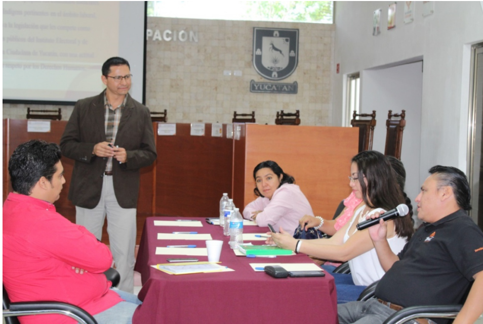
Figura 20. En el Curso-Taller de “Derecho Indígena participaron un total de 34 personas y tuvo una duración de 15 horas.

Derivada del Diagnóstico de necesidades de capacitación realizado por la Unidad del Servicio Profesional Electoral en diciembre de 2015, del 11 al 23 de abril se impartió a personal del Instituto una capacitación básica y especializada en Windows Avanzado; participaron 20 trabajadores en las instalaciones de la empresa Aster, y el curso constó de cuatro sesiones para cada grupo de participantes, con duración total de 20 horas.