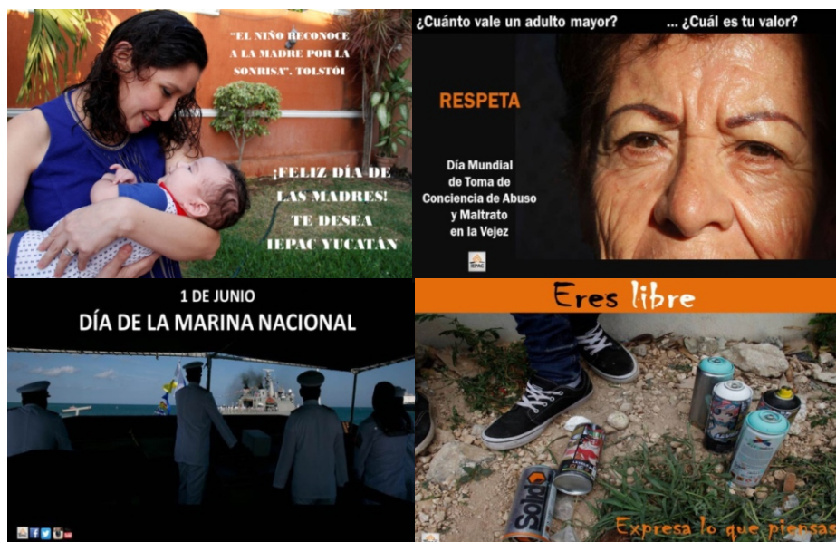
Figura 31, 32, 33 y 34. Hasta el mes de junio se emitieron 140 publicaciones en Facebook, 191 en Twitter; y 30 en Instagram, relacionadas con actividades del Instituto y efemérides representativas.

En materia de la relación con medios de comunicación se estableció un esquema de trabajo que permite generar paquetes informativos con audio, fotografías, texto y video, así como el envío de material de acuerdo al perfil del medio (entrevistas radiofónicas, reel de imágenes para televisión, fotografías y audio y texto para prensa), para facilitar la difusión de las acciones del Instituto e informar al mayor número posible de ciudadanos.