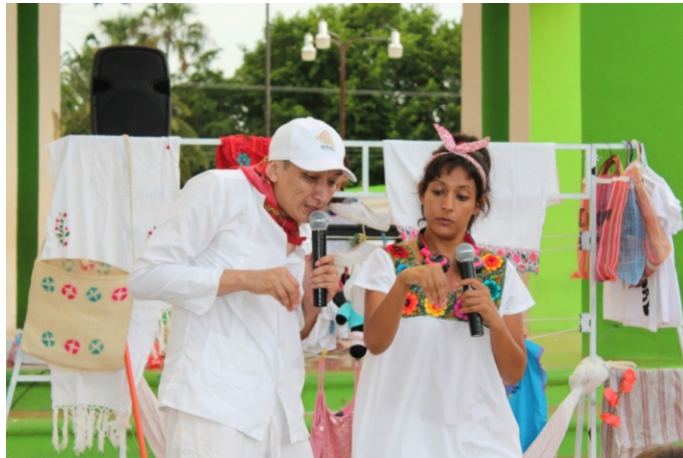
Figura 13. Con un lenguaje coloquial y un guión diseñado para difundir de forma clara los mecanismos de consulta popular se presentó en municipios del interior del estado la obra “ Si