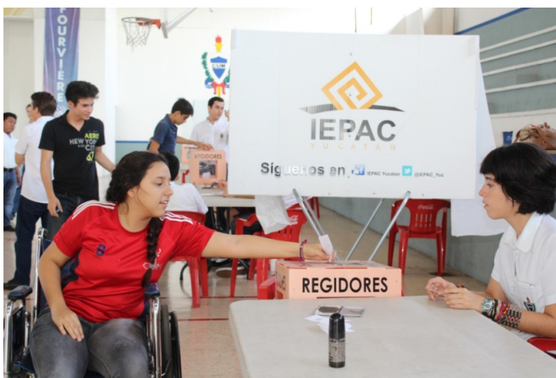
Figura 12. Mediante un proceso democrático los jóvenes decidieron sobre aspectos de liderazgo en su escuela y compartieron ideas sobre los derechos y responsabilidades de los ciudadanos.