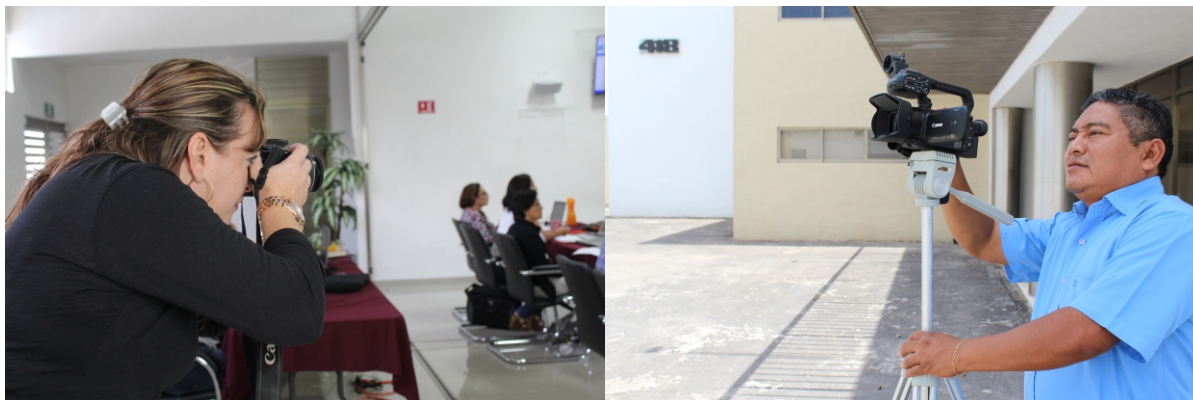
Figuras 39 y 40. El apoyo de cobertura fotográfica y de video a eventos internos se realizó con fines de difusión y para archivo interno.

Se apoyó con cobertura con audio, fotografía y video a programas ejecutados por las direcciones de Capacitación Electoral y Educación Cívica; de Procedimientos Electorales y Participación Ciudadana; Secretaría General y de las Unidades de Servicio Profesional Electoral y de Transparencia.