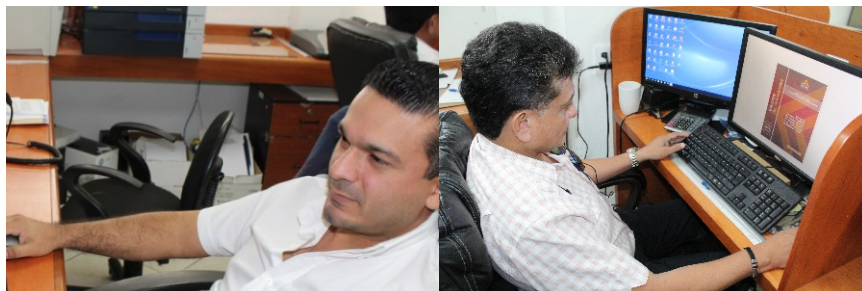
Figura 26 y 27. De manera general se atendieron las necesidades en materia de diseño gráfico que solicitaron las diferentes áreas por medio de 74 solicitudes de órdenes de trabajo.

Se atendió a la Comisión Permanente de Participación Ciudadana con el diseño, ajuste y envío del Catálogo de Políticas Públicas y Acciones Gubernamentales Transcendentales en el Estado de Yucatán para el año 2016.