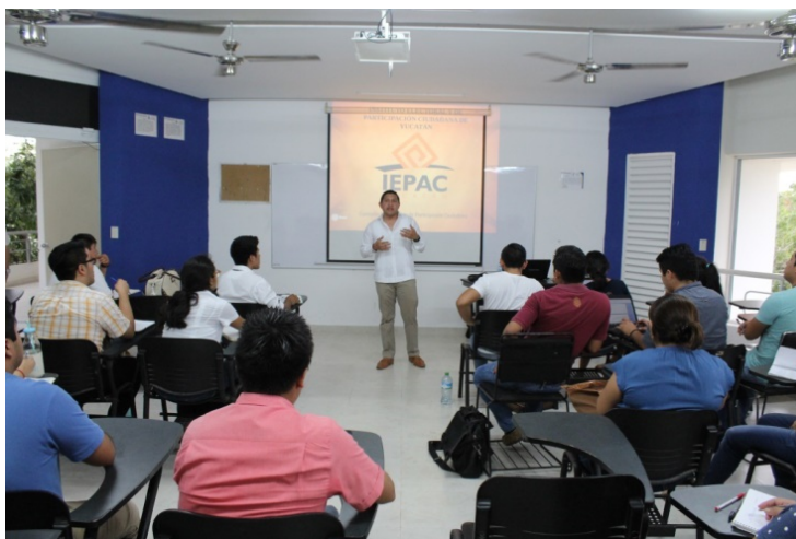
Figura 7. Personal del Instituto en charla con jóvenes estudiantes de Derecho, fomentando la participación ciudadana.

La Facultad de Derecho de la UADY cuenta dentro de su retícula de materias con una denominada “ Participación Ciudadana ” en modalidad de asignatura libre a invitación del profesor que imparte dicha asignatura la Dirección Ejecutiva de Capacitación Electoral y Educación Cívica en coordinación con la Dirección Ejecutiva de Procedimientos Electorales y Participación Ciudadana elaboró e impartió una plática a los jóvenes acerca de la aplicación de valores y practicas democráticas como la legalidad, el diálogo, la libertad, la veracidad, la pluralidad y la justicia en la vida política, escolar y en la sociedad en general, así como la importancia de estos valores en su formación como futuros profesionistas.