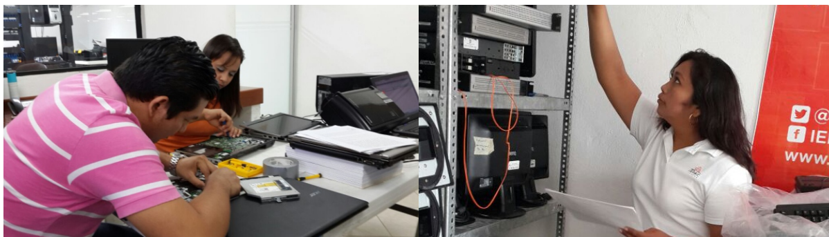
Figura 29 y 30. Personal de soporte técnico de la Unidad de Informática y Diseño brindó diversos servicios.

Se atendieron las necesidades que presentaron las diferentes áreas en materia de soporte técnico mediante 127 solicitudes de servicio.