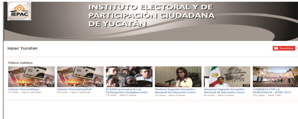
Figura 28. Canal del IEPAC en YouTube.

Se creó un canal de video en internet mediante la plataforma YouTube de carácter Institucional, y con el apoyo de la Oficina de Comunicación Social se grabaron, editaron y liberaron tres videos.