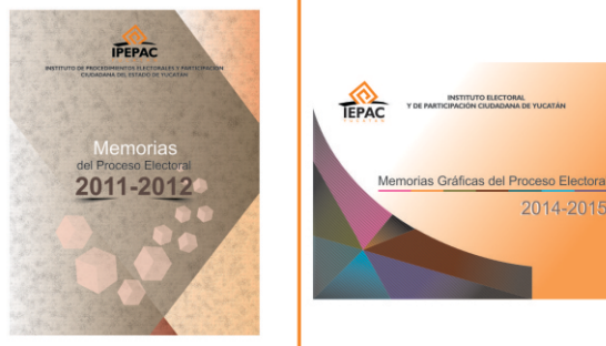
Figura 25. Memorias de los procesos electorales 2011-2012 y 2014-2015.

En coordinación con la oficina de Comunicación Social se elaboró el diseño y edición de las Memorias del Proceso Electoral 2011-2012 , al igual que el diseño y edición de las Memorias Gráficas del Proceso Electoral 2014-2015 .