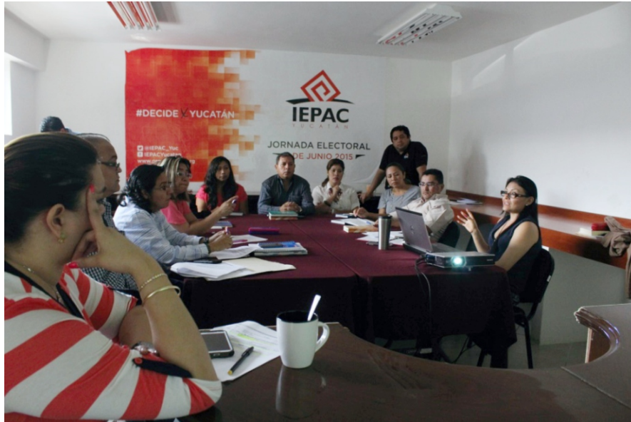
Figura 2. El área coordinadora de Archivo y Gestión Documental capacitó a personal de diversas direcciones sobre la forma correcta de llevar un mejor control para la consulta archivística.

El área coordinadora de Archivo y Gestión Documental realizó diversas actividades en coordinación con las Unidades Administrativas con la finalidad de crear instrumentos de control y consulta archivística que faciliten la clasificación y organización, así como el manejo y acceso a los documentos de archivo que se producen, dicha labor dio como resultado la elaboración y aprobación de la primera herramienta denominada “ Cuadro General de Clasificación Archivística ”, los objetivos alcanzados fueron: proporcionar a las unidades administrativas elementos básicos de la Archivística y la Administración de documentos; la depuración de documentos sin valor (inservibles) de las unidades administrativas; el “Cuadro General de Clasificación Archivística” y aprobado mediante Acuerdo C.G.-010/2016 de fecha 31 de mayo de 2016; la coordinación entre unidades administrativas del Instituto y el área de Archivo y Gestión Documental y; la homologación en la organización y clasificación de los Archivos de Trámite de las unidades administrativas de este Instituto, utilizando los mismos criterios a fin de que exista un mejor control en sus archivos.