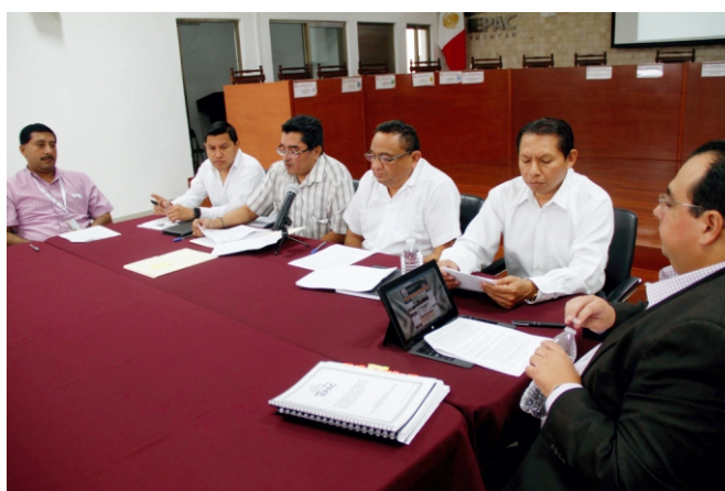
Figura 24. Aspectos de la primera sesión del Comité de Transparencia, en la cual el titular de la Unidad de Transparencia desempeña la función de secretario técnico.

La Comisión de Transparencia y Acceso a la Información ha sesionado dos veces durante el periodo: