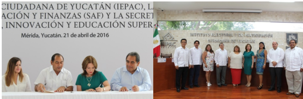
Figuras 37 y 38. Aspectos de la firma de convenios.